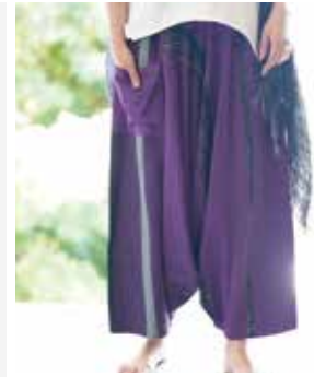
tamaki niime ※画像はイメージです