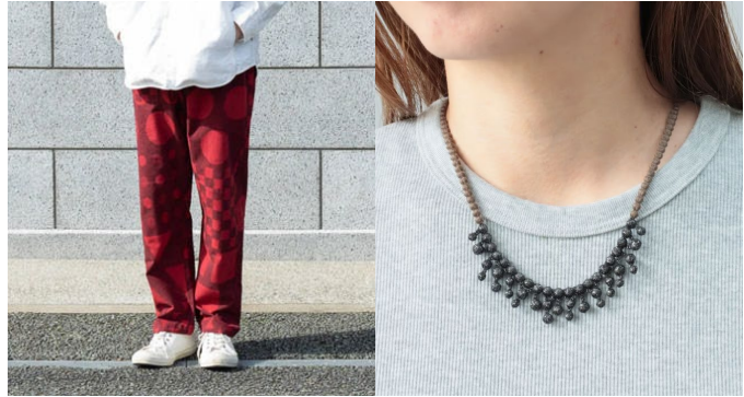
〈左〉うなぎの寝床 〈右〉000(トリプルオウ)

クリスマス、冬休み、バレンタインに送別のシーズン。これから春にかけて特別なイベントが続きます。そんな特別な日にも頼れる「お客様のお墨付き」商品を揃えました。「毎年買ってしまおう!」とファンの多いブランドや「KOMINKANでも仕入れてほしい!」とご要望が多かった商品も合わせてご紹介いたします。ぜひ手にとって「お墨付きの理由」を感じてください。