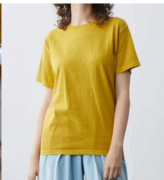
〈左〉カリオモンズコーヒー 〈右〉good on