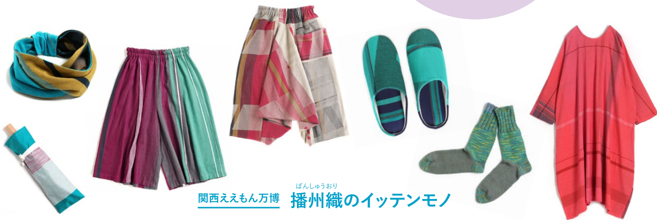
ぼんしゅうおり 関西えもん万博 播州織のイッテンモノ