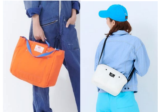
BAG 'n' NOUN

2024年最初のスペシャルでは「関西のええもん」をセレクト。関西は、食い倒れだけでなく、着倒れ、履き倒れとしても知られるファッションが盛んなエリア。上質な織物も有名です。兵庫県からはKOMINKANでもファンが多いtamaki niimeのアイテムがこれまでで最も多く入荷します。大阪生まれの老舗メーカーが手がけるバッグ バグンナウンも、好みの色が見つかる豊富な品揃え。おしゃれを楽しんでいただけるよう、この1年もよいもの、心が躍るものをお届けいたします。