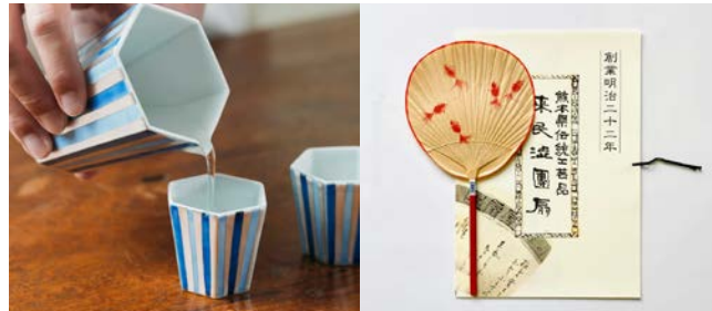
〈左〉片口酒器 〈右〉栗川商店

夏の夜の心地よい過ごし方をイメージしたセレクト。デザインが美しい花火、和紙に柿渋を塗って仕上げた渋うちわに、片口酒器で楽しむお気に入りの冷酒。ほてった肌をさらっと包む快適な部屋着など。自分用にも夏ギフトにも最適な一品をご紹介します。