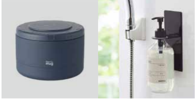
〈左〉thermo mug / ピッタリ重ねて収納できるキャニスター 〈右〉tower / マグネットバスルームディスペンサーホルダー

まだ肌寒さはありますが、もうすぐ春がやってきます。新しい暮らしをスタートさせる人は、新生活に向けて準備をされる時期。KOMINKANでは心がウキウキ豊かになるようなアイテムを揃えました。初めての一人暮らしや新生活に喜ばれるものや、門出を迎える方へのお祝いの品、お世話になった方へのお礼。もちろん、新しいことを始めたい！という方へのご提案も。準備万端で桜前線を迎えられるよう、整えてお待ちしております。