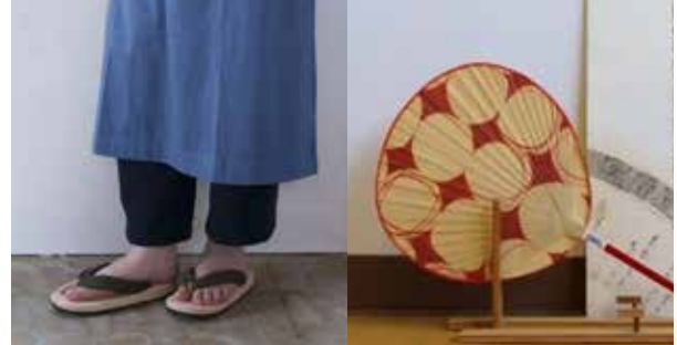
(左)うらつか工房 (右)栗川商店

素材、質感、見た目のデザイン。職人が一つ一つこだわった手仕事で、夏を心地よく涼やかにしてくれます。素材や工程にこだわるだけでなく、職人の美学や哲学が宿る逸品たち。九州各地でその土地の環境や自然、人々のつながりを活かして真摯にものづくりに励む職人さんたちにスポットを当てるフェアです。美しく涼やかな夏のアイテムを探しにきませんか。