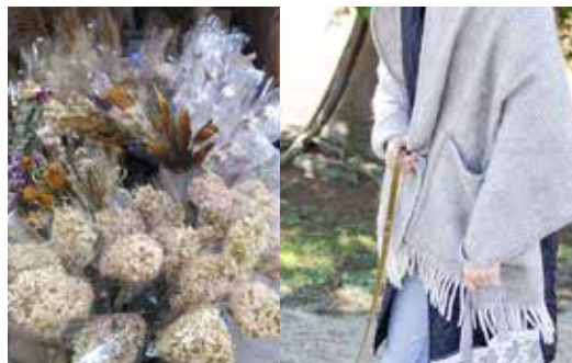
(左)フロストクラフト (右)ラブアンカンクリ

1年間頑張った自分へのごほうびに。クリスマスのギフトに。年末年始のお土産に。贈って喜ばれる、間違いなしのアイテムをご覧ください。