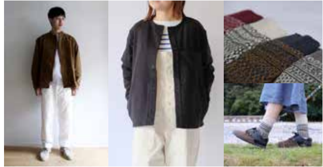
(左)CATTA (中)JAMES&CO (右上・下)西口靴下

寒いといろんなことが億劫になってしまうけれど、その分、着る幸せは1枚、2枚と増えていきます。きちんと防寒できる機能性とおしゃれさの両立をかなえるアイテムをセレクトしました。