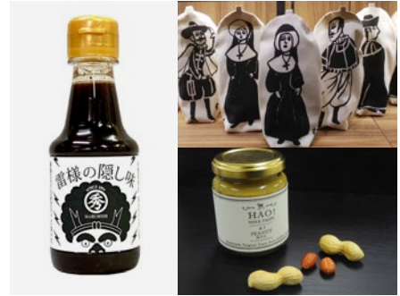
(左)雷様の隠し味/佐賀 (右上)クルス ベンケース/小浜 (右下)HAO!ピーナッツペースト/小値賀

ここに暮らすわたしたちが地元も近所もステキだと知ることが、移住とか定住とか観光とか、大きな問題を解決したりしちゃうんじゃないかと思っています。