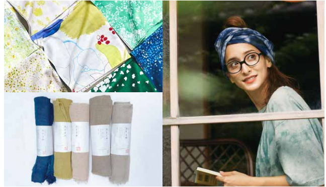
(左上)naniiRO (左下)アイアカネ工房 (右)CHAORAS

久しぶりに自然の中に身をおいてみると、木々や花々の色の多様さ、美しさに目を奪われます。今回は、そんな天然素材を使った染めがテーマ。不思議なことに、天然素材は人の肌を美しく見せてくれる魅力もあります。ぜひ鏡の前であててみてください。