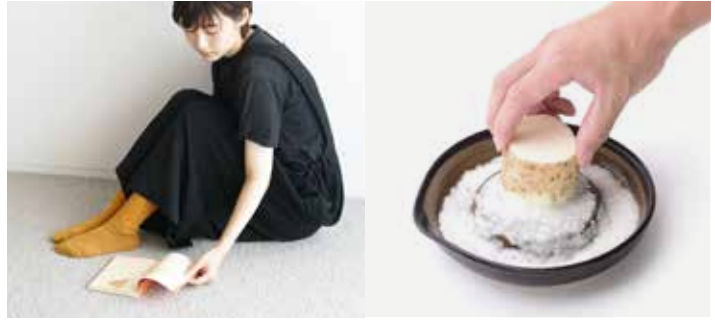
(左)ソックス/hakne (右)おろし器/もとしげ

肌寒い季節に、ほっとできるアイテム。やわらかなブランケットや、気持ちの良い肌着、あたたかでやさしいお洋服など、秋冬のおともになるアイテムを集めました。厚手のお洋服に合わせて、すい小物も入荷します。